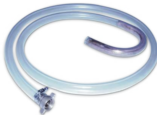
Tuyau de déversement inclus (2 m). Including evacuation tube (2 m). Inclusief uitloopdarm (2 m).

Het toestel opent automatisch de nodige waterdoorvoer, nl. heet of gekoeld water.