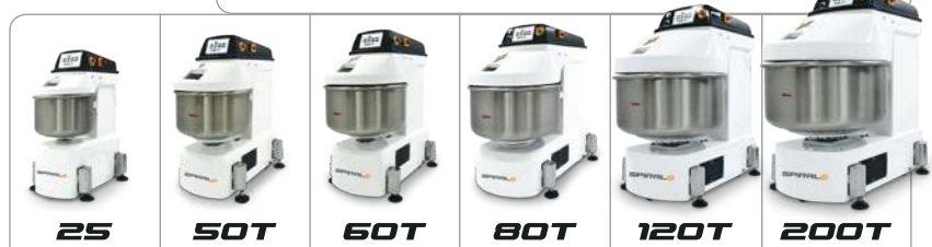
25 50T 60T 80T 120T 200T